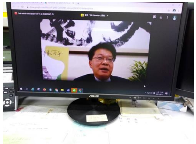
家長會莊會長致詞